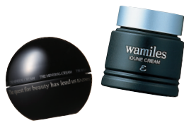
ザ ミネラルクリーム