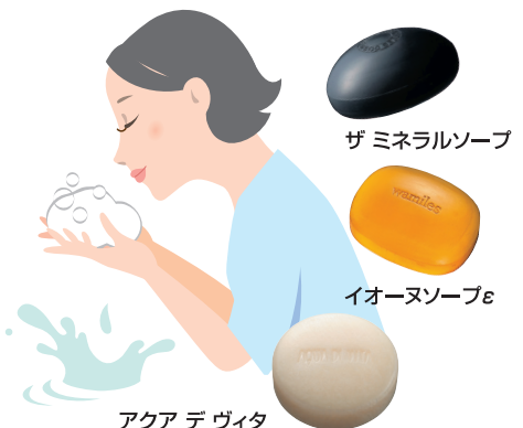
アクア デ ヴィタ ヴィフィーセ ソープリファイナー